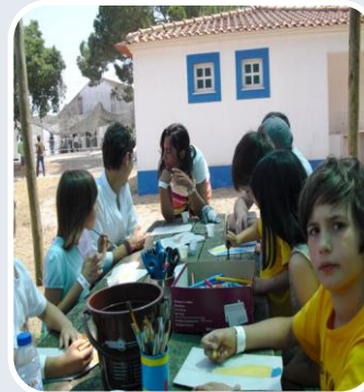
Observa Natura 2010