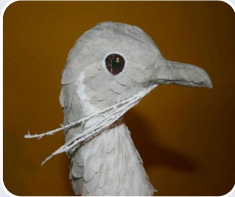
Maquetes das 3 espécies alvo