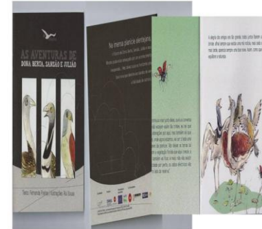
Conto Infantil Ilustrado