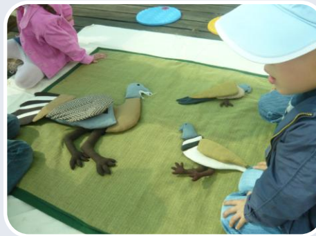
Tapete de atividades em patchwork