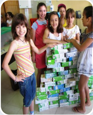
Dia Eco Escolas 2010/11