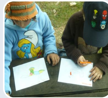
Atividades no Monte do Vento