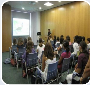
GREN FEST 2010